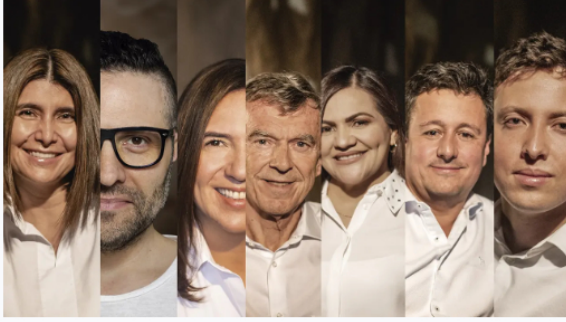
Estos son los CIO del año 2023 en Colombia