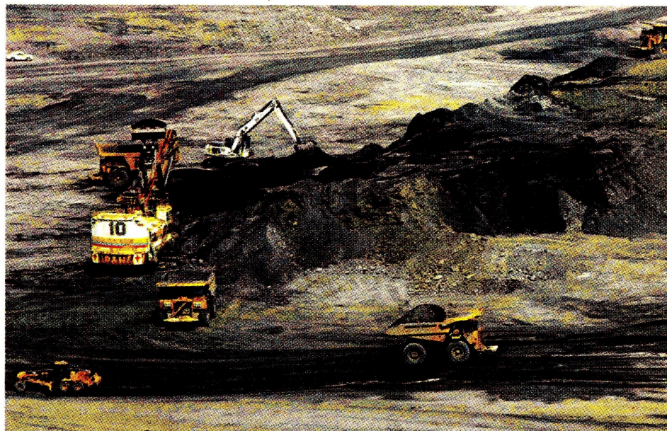
La Contraloría estima que hay reservas por $111,4 billones en el subsuelo del país.

“Teniendo en cuenta que los estudios de exploración únicamente abarcan el área concesionada junto con el área de influencia de la misma, la cuantificación de las reservas refleja ma-