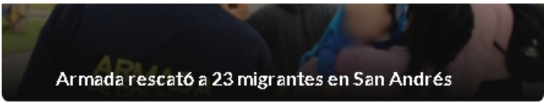
Armada rescató a 23 migrantes en San Andrés