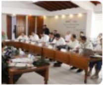
Compromisos para la tranquilidad de Ocaña