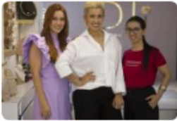
Diseñadoras cucuteñas, en feria de Nueva York