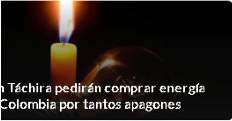
En Táchira pedirán comprar energía Colombia por tantos apagones