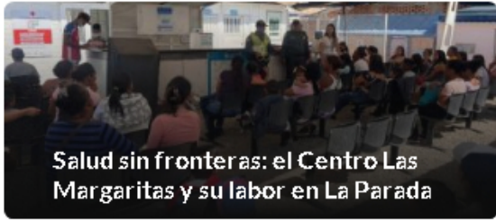
Salud sin fronteras: el Centro Las Margaritas y su labor en La Parada