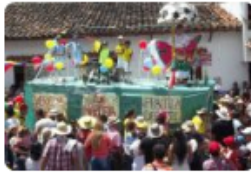
'Calibre 50' estará en la Feria Internacional de Chinácota que se inicia hoy