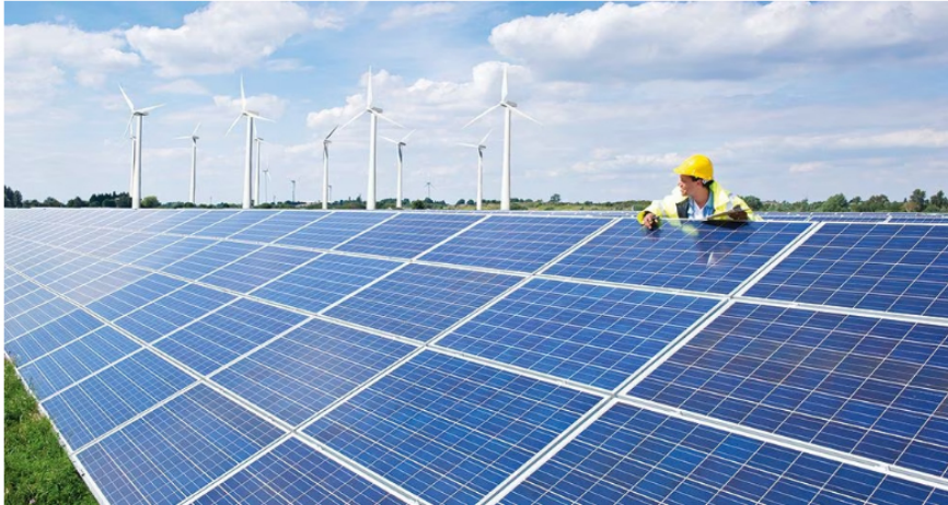
Los bloqueos y la baja dinámica en el desarrollo de las energías renovables son factores críticos en el sector. El fenómeno de El Niño está afectando los precios en bolsa, que se encuentran disparados.

Y agregó: "No podemos predecir el impacto de El Niño sobre la disponibilidad de nuestros recursos, pero la realidad es que nos estamos gastando el agua de los embalses a mayor velocidad de lo que se están llenando. Por eso, nuestra prioridad debe ser garantizar el abastecimiento desde hoy y durante los próximos meses, en los cuales se sentirá con mayor intensidad el fenómeno de El Niño ".