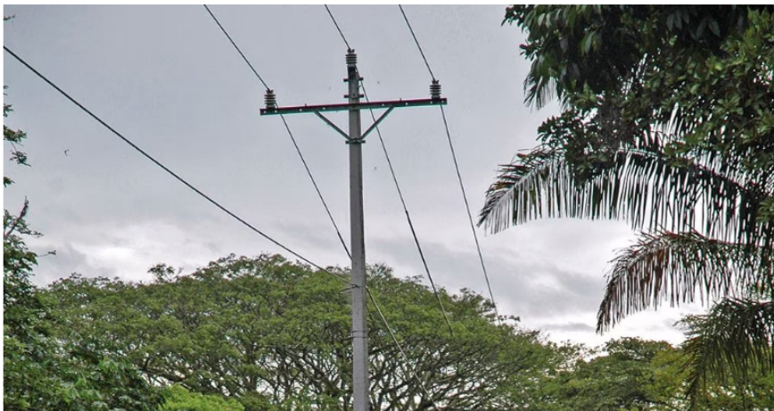
Aumentan las posibilidades de un apagón en Colombia.

Con las facturas del servicio de energía no habría escapatoria. En ellas se vería reflejado el efecto de la sequía, ya que aumentan los costos de producir electricidad. Todo, porque la energía más barata es la hidroeléctrica, que, además, es la principal fuente del país y al disminuir los niveles de agua también se reduce la generación, necesitando así echar mano de la energía térmica, mucho más costosa de producir.