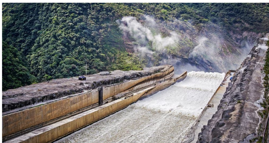
Las hidroeléctricas podrían tener una labor clave para evitar el apagón.

Ella agregó que las renovables son una excelente opción para atender esa necesidad porque cumplen tres grandes requisitos: bajas emisiones, costos competitivos para los usuarios y tiempos de construcción relativamente cortos. "Pero los tiempos de trámites excesivamente largos versus la complejidad técnica de los proyectos están demorando la materialización de esta alternativa energética", agregó Hernández.