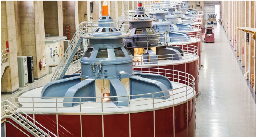
Las alertas por un apagón preocupan al país.