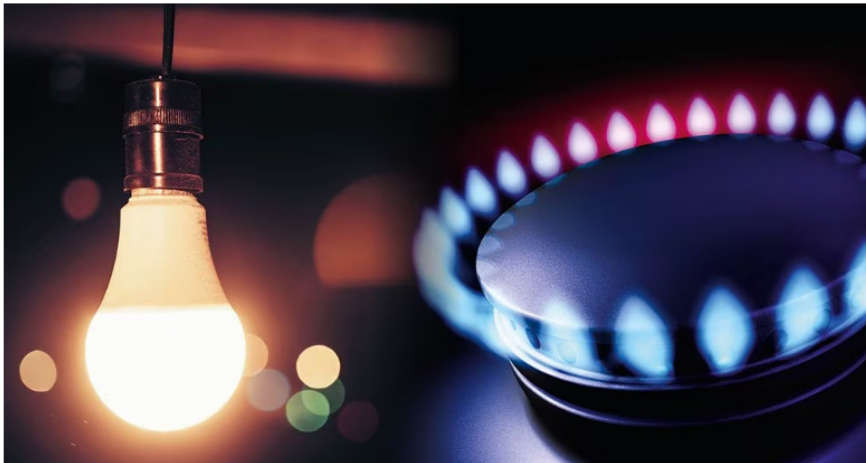
La demanda de energía está aumentando. Según XM, subió en 6,23 por ciento en agosto. Al mismo tiempo, están bajando los aportes de lluvia a los embalses.

Agregó que en términos de energía los datos muestran que el país tiene el cubrimiento suficiente, "así que el tema más importante que estamos atendiendo es el financiero para que las empresas puedan superar el fenómeno de El Niño. Nosotros no estamos viendo un apagón en términos de energía, estamos viendo unas dificultades económicas y financieras de las empresas frente a las cuales estamos desarrollando un paquete de medidas que nos permita ofrecerle al país la garantía de no tener ninguna afectación", dijo.