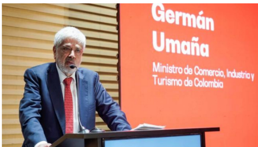
Germán Umaña, ministro de Comercio, Industria y Turismo, en el foro de Cooperación.

(Le puede interesar: Abandonan cuerpos de seis bebés muertos en la entrada de un cementerio: ¿qué se sabe? )