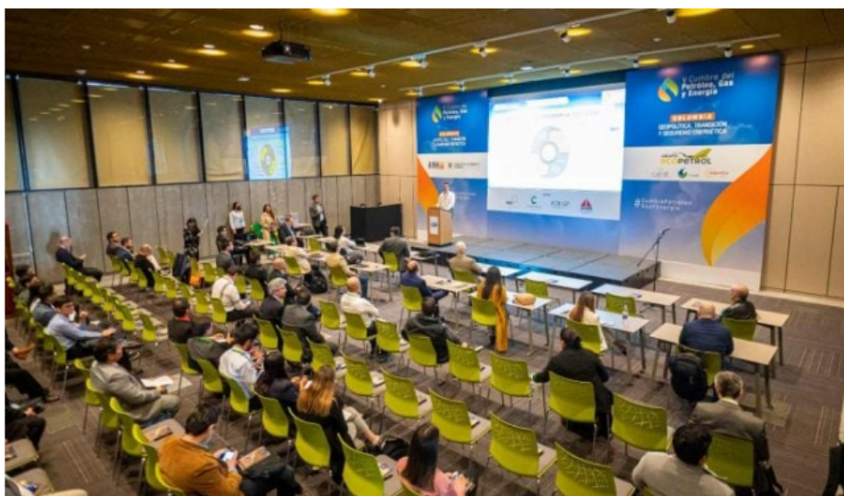
Cumbre Petróleo, Gas y Energía, Imagen: Cortesía ACP.

La VI Cumbre del Petróleo, Gas y Energía de Colombia se llevará a cabo este año por primera vez en Cartagena de Indias del 24 al 26 de octubre de 2023.