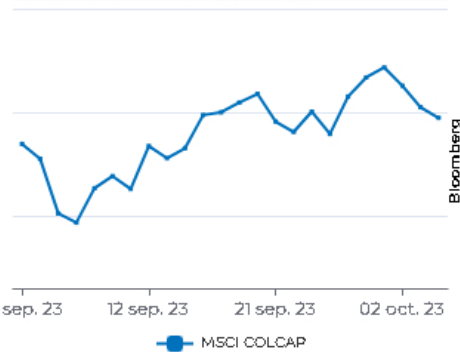
MOVIMIENTO DEL MSCI COLCAP

El índice que refleja las variaciones de los precios de las