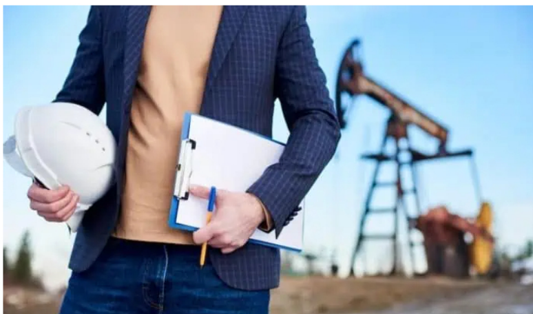
GeoPark y Hocol (filial de Ecopetrol ) anuncian descubrimiento de hidrocarburos en Colombia.

GeoPark, compañía latinoamericana dedicada a la exploración y producción de petróleo y gas, y Hocol, empresa filial del Grupo Ecopetrol , confirmaron un nuevo éxito exploratorio en el pozo Toritos 1 del bloque Llanos 123, ubicado en Colombia.