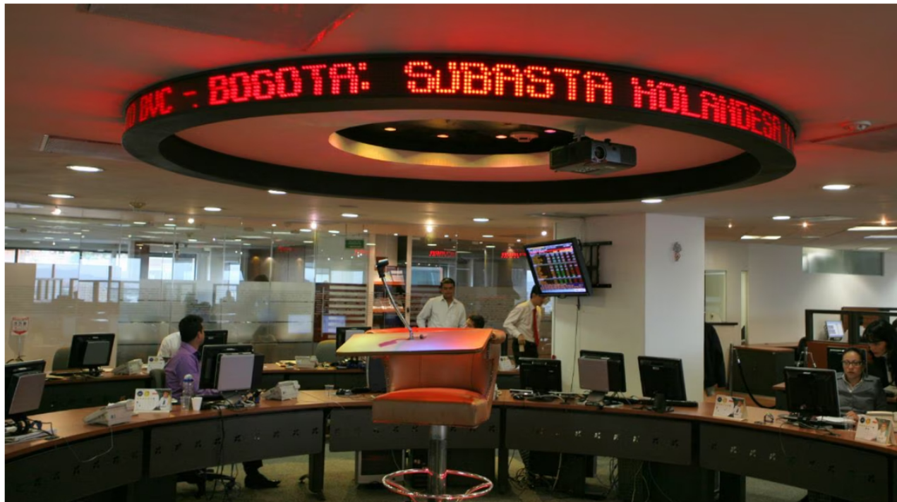
Estos son los movimientos en la bolsa, hoy 4 de octubre.

Durante el inicio de la jornada de cotización de este miércoles 4 de octubre, los índices de la Bolsa de Valores de Colombia amanecieron con números rojos y caídas importantes. Por su parte, el mercado de renta variable tampoco tuvo un buen inicio y son pocas las acciones que hoy logran repuntar.