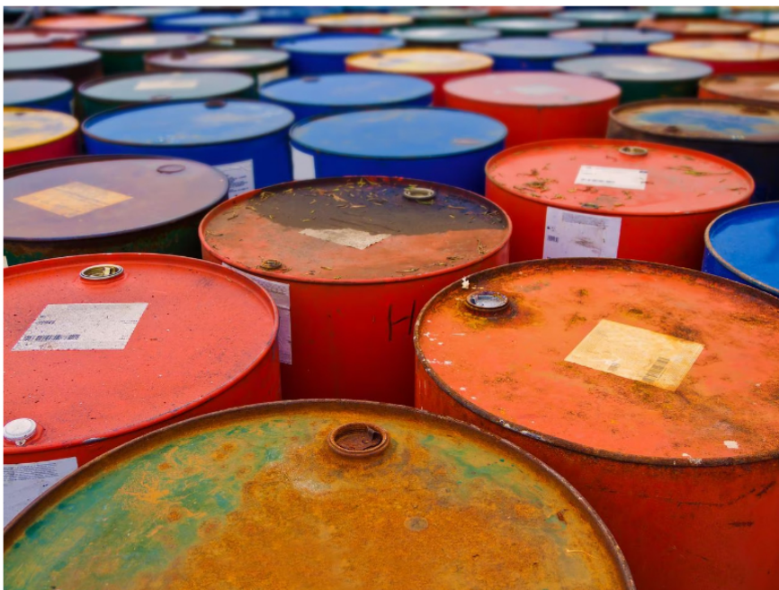
El petróleo cae hoy 4 de octubre en dos de sus referencias más importantes.

El WTI (West Texas Intermediate) registra hoy un valor de 86,10 dólares por barril, lo que significa una caída del 3,51% en su precio. Este es uno de los crudos más populares en el mercado estadounidense.