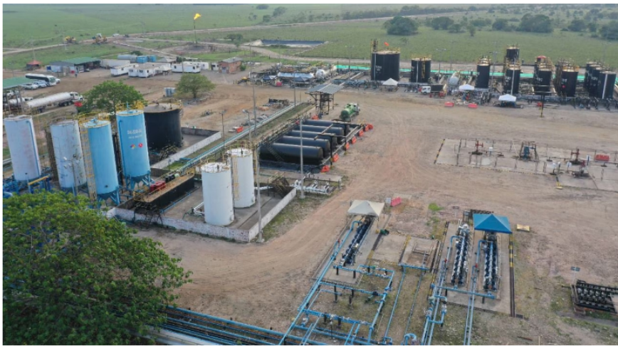
Contratos de exploración de petróleo y gas.