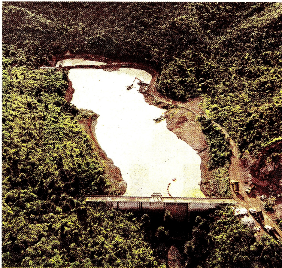
XM ya manifestó que 17 comercializadoras podrían tener dificultades financieras.

Esto se ha visto reflejado en el precio de bolsa, cuyo