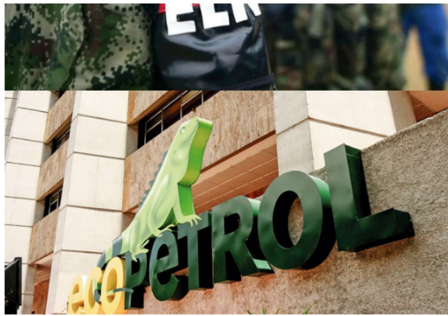
ELN y Ecopetrol | Foto: Suministradas

“Consignan información falaz como es el origen de los campos o plantas de producción que se han determinado que no existen dentro de los agentes de la cadena de distribución, por lo que se convierte en un mecanismo práctico para la organización en pro de disuadir los controles de las autoridades”.