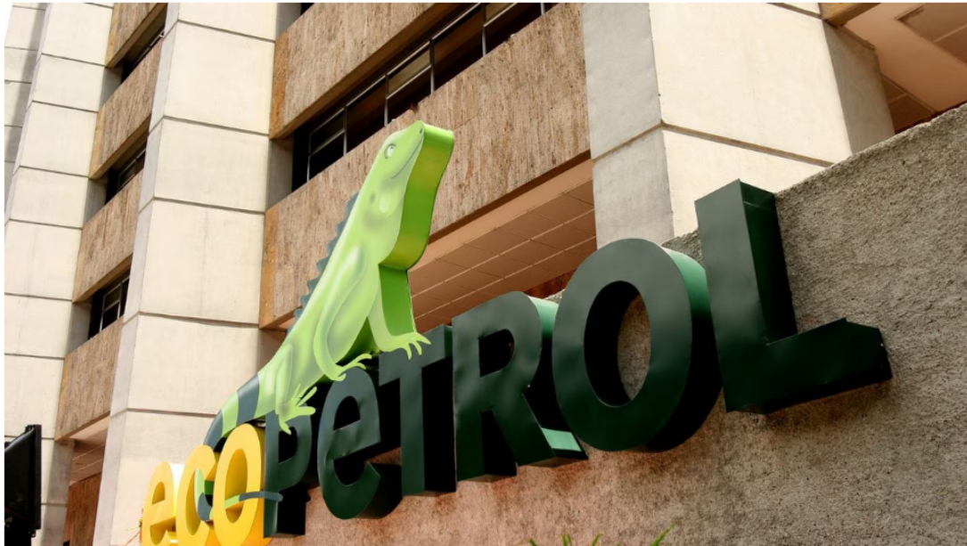
ECOPETROL. FACHADA BOGOTÁ AGOSTO 17 / 2007

3 de octubre de 2023 Por: Redacción El País