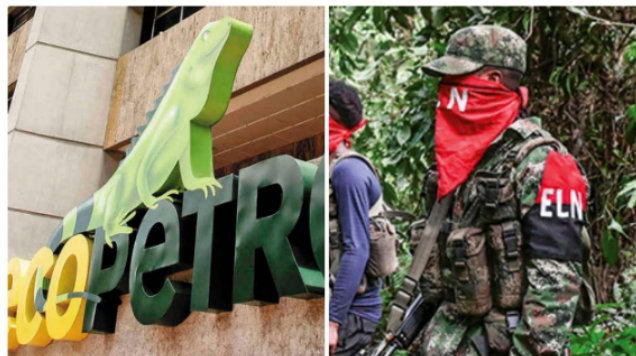
Los detalles de cómo exportaban y le revendían a Ecopetrol el crudo que el ELN y empresarios le robaban.