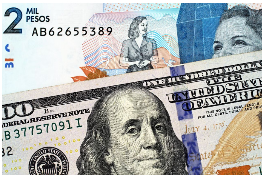
Dólar se dispara en Colombia y empieza a acercarse a los $4.200