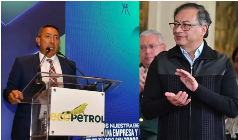
Colombia pagará 2.000 millones de dólares a Ecopetrol .

El gobierno de Colombia, dirigido por el presidente Petro pagará a la petrolera estatal Ecopetrol (NYSE/BVC: EC) más de 8 billones de pesos ($2 mil millones de dólares) por su contribución en efectivo al Fondo de Estabilización de Precios de Combustibles correspondiente al tercer trimestre, informó Reuters el lunes.