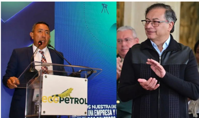
Colombia pagará 2.000 millones de dólares a Ecopetrol .

Los inversionistas de Wall Street han quedado impresionado con el cumplimiento del gobierno Petro con sus obligaciones. Ni siquiera algunas líderes que posan de capitalistas han cumplido como este gobierno.