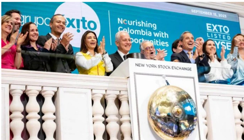
Toque de campana del Grupo Éxito en la Bolsa de Valores de Nueva York.

Las acciones de empresas colombianas que cotizan en la Bolsa de Nueva York en EE. UU. y la Bolsa de Toronto en Canadá tuvieron un septiembre en general de pocos movimientos, en medio de la fuerte caída de los mercados norteamericanos.