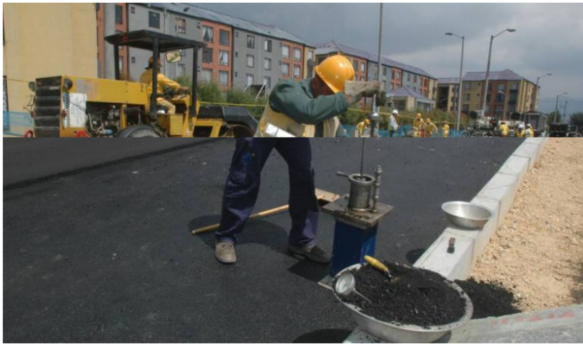
A través de la compensación de emisiones de carbono, Ecopetrol busca promover proyectos que evitan o capturan las emisiones de gases de efecto invernadero.

La compensación equivale a un volumen de 1.238 toneladas de dióxido de carbono. Se distribuyeron 4.000 toneladas del producto en el mercado colombiano.