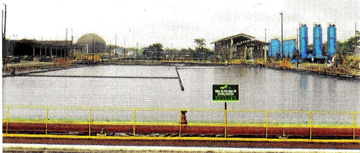
Planta de tratamiento de agua de producción ubicada en Acacías. ECOPETROL

MENFY MÉNDEZ MEJÍA mmendez@larepublica.com.co