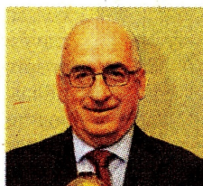
Leonardo Villar, gerente General del Banco de la República