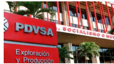
AUMENTA PRODUCCIÓN DE CRUDO de Venezuela: hace efecto el alivio de las sanciones