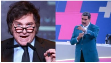
¿UNA PUNTA A MILEI? Maduro asegura que Venezuela y Argentina son "pueblos hermanos"