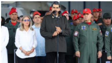
¡LA HORA DE LA JUSTICIA! Maduro y la FANB reafirman estar preparados