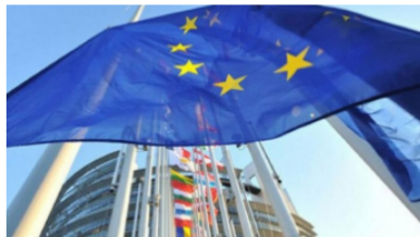
UNIÓN EUROPEA RELAJA SANCIONES A VENEZUELA para facilitar acceso a