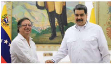
Expresidente de Ecopetrol ve como UNA LOCURA posible alianza con PDVSA