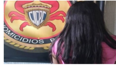
No quería hacerse responsable por la mantención de su hija y LO MANDÓ A MATAR