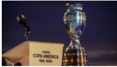
¿A quién se enfrentará La Vinotinto? Definen bombos de la Copa América 2024