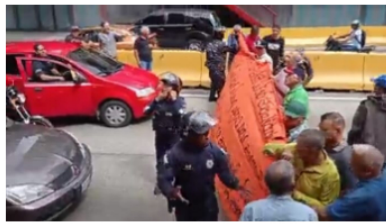
Jubilados de PDVSA cierran avenida Libertador de Caracas en protesta por sus fondos de pensiones este #23Nov