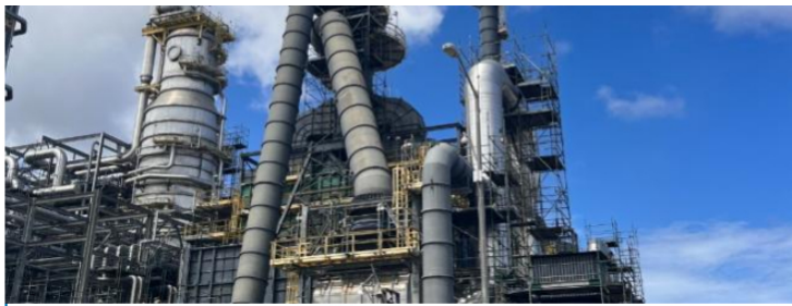
Refinería de Cartagena.