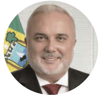
JEAN PAUL PRATES Presidente de Petrobras

Según el reporte más reciente de la Agencia Nacional de Hidrocarburos (ANH), las reservas probadas de gas en el país se situaron en 2022 en 2,82 tetra-piés cúbicos (TPC), con una diferencia de -0,35 frente a 2021. Esto significa que Colombia ya no cuenta con reservas para 8 años sino para 7,2, su nivel más bajo en 17 años. Para Alberto Moncada, docente de la Universidad Externado, pese a los descubrimientos de gas en el mar Caribe colombiano (Orca, Gorgón, Uchuva, entre otros), estos recursos se consideran contingentes, ya que es necesario delimitar el tamaño de los yacimientos para determinar su potencial, diseñar las instalaciones de producción y el gasoducto submarino para así determinar su viabilidad económica. Un proceso que, dijo, toma entre cinco y siete años.