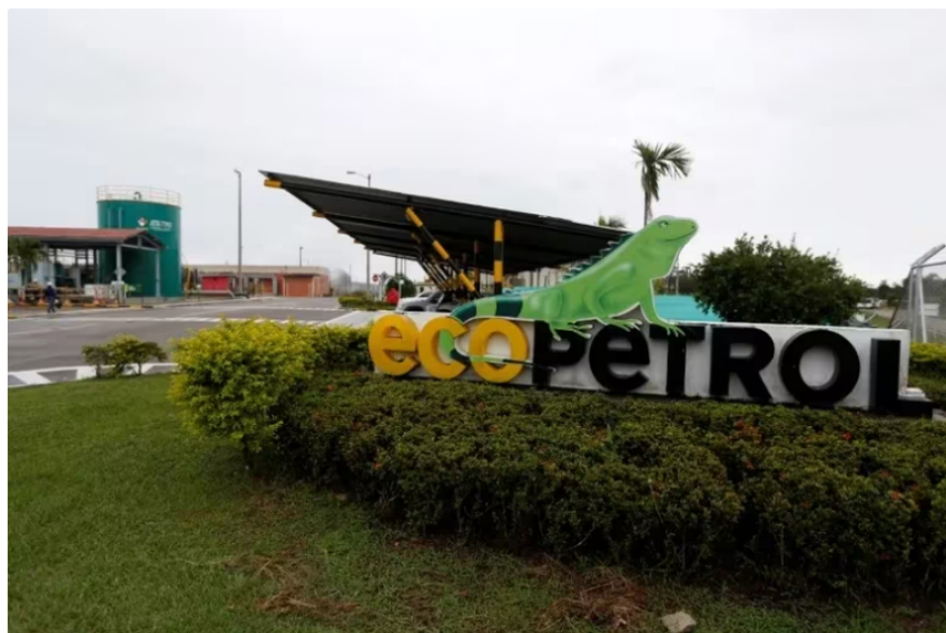
Entrada a campo de Ecopetrol