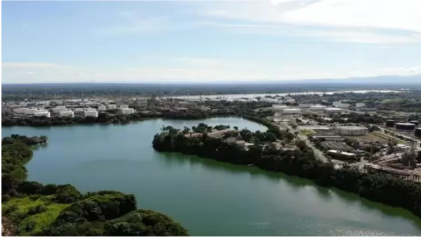
Imagen aérea de Barrancabermeja