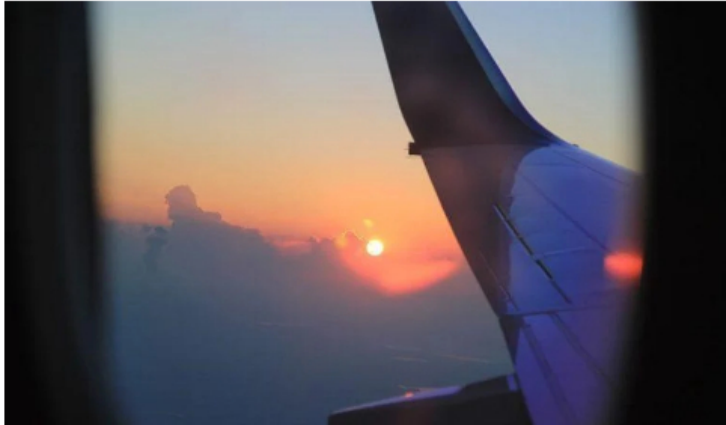
El combustible SAF es la alternativa sostenible para el sector aéreo en los próximos años.

Adicionalmente se espera que, con esa nueva refinería, la estatal petrolera pueda ver utilidades que doblen la inversión inicial dado un mercado que, según París, sigue creciendo con fuerza.