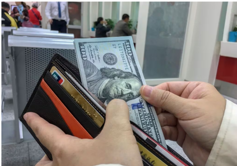
Así se cotiza el dólar en casas de cambio este 24 de noviembre.

Antes de hacer algún tipo de compra en casas de cambio, es importante que primero conozca la dinámica bajo la que funcionan estas casas, pues así podrá aprovechar los precios de una forma más conveniente. Normalmente los precios que son fijados en los establecimientos se hacen con base en la ley de oferta y demanda.