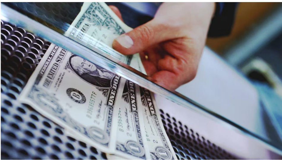
Las casas de cambio funcionan bajo la ley de oferta y demanda.

Si desea ir un poco más atrás, también puede revisar el comparativo de la divisa en varios periodos de tiempo. Esta es la diferencia con precios hace un año, una semana, un mes y un día.