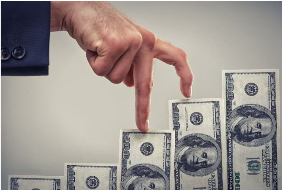
Dólar sigue encareciéndose en Colombia

paulatinamente con la transición energética, también representa una buena entrada de divisas al país, pues Ecopetrol recibe buen dinero por exportar crudo para refinar a diferentes partes del mundo.