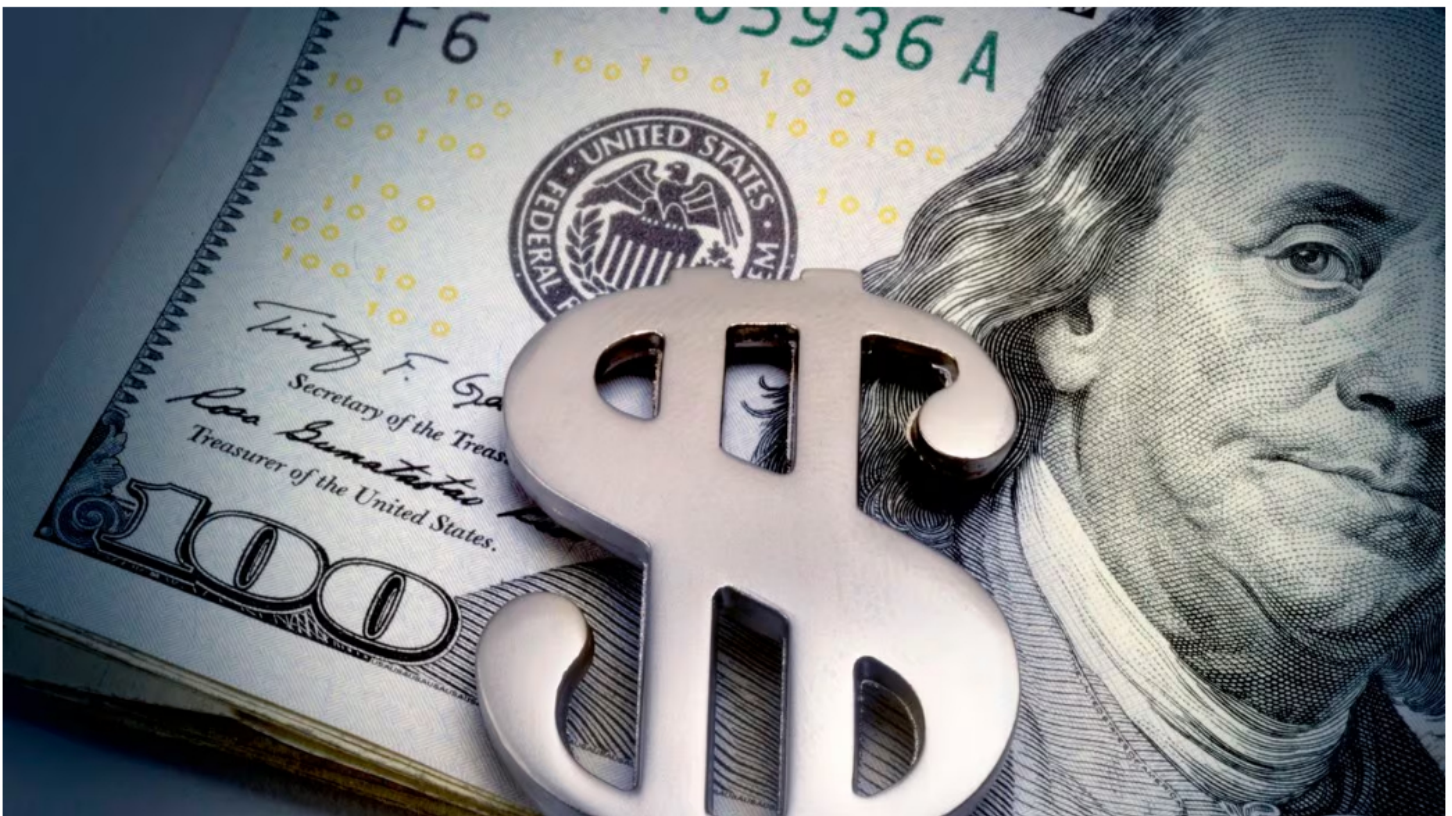
Así se cotiza el precio del dólar en casas de cambio.

El dólar ha sido uno de los temas económicos que más ha generado preocupación en los colombianos durante el último año. Esto debido a que el precio de la divisa tiene una alta incidencia en las finanzas de los colombianos debido a que el país compra un gran número de productos importados, cuyo precio se fija precisamente con el dólar.