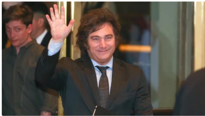
El presidente electo de Argentina, Javier Milei se retira del Hotel Libertador.

Conversaba el domingo 19 de noviembre, día del balotaje en Argentina, con una periodista brasileña sobre el proceso previo a los resultados; le decía que era previsible que ganaría la derecha; y ella me respondía "bueno aquí ambos candidatos son de derecha". El diálogo se puso interesante al manifestarme jocosamente "tampoco es para que los venezolanos salgan a celebrar", a lo que respondí