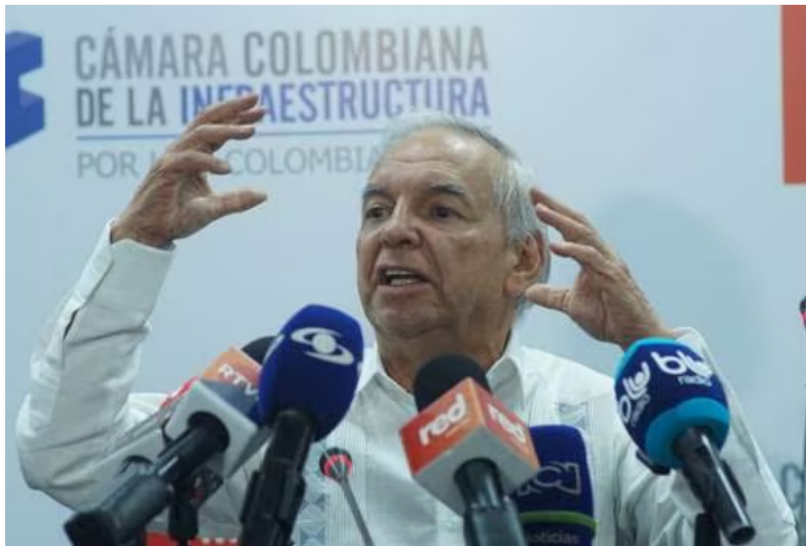
Ricardo Bonilla, ministro de Hacienda

Redacción Economía 24 de noviembre de 2023 - 06:18 p. m.