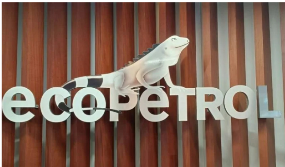
Sindicato de Ecopetrol apoya transición, pero advierte “medidas más drásticas” si se rebaja la inversión.