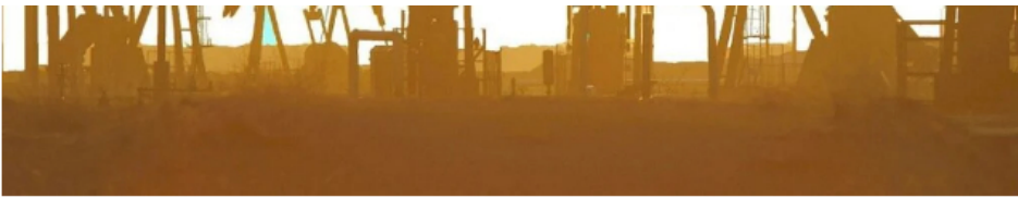
Producción de petróleo.