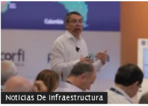
Noticias De Infraestructura

Así subirán las tarifas de peajes en Colombia en 2024