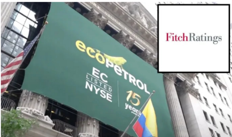
Ecopetrol con calificación estable por parte de Fitch Ratings.

La petrolera Ecopetrol informó que la calificadora Fitch Ratings afirmó la calificación de incumplimiento de emisor de largo plazo en moneda local y extranjera de la compañía en «BB+», con perspectiva estable.