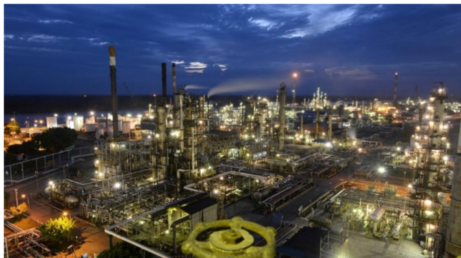
Refinería de Ecopetrol

Por: María Fernanda Tarazona Martínez Jueves, Noviembre 23, 2023 - 09:42