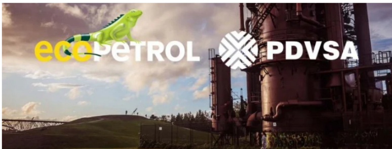
Imagen de fondo: maxwbender en Unsplash

Recomendado: Ecopetrol sí contempla opción de importar gas de Venezuela