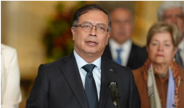
Presidente de Colombia, Gustavo Petro.

Síguenos en nuestro canal de noticias de WhatsApp