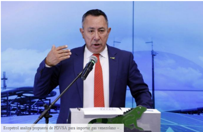
Ecopetrol analiza propuesta de PDVSA para importar gas venezolano –

Bogotá (EFE).- La petrolera estatal colombiana Ecopetrol aseguró que analiza la propuesta de su par venezolana PDVSA de importar gas de ese país a Colombia en diciembre de 2024 "en el marco del levantamiento de las restricciones impuestas por Estados Unidos "sobre la nación caribeña.