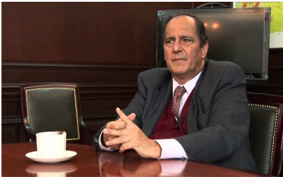
Juan Camilo Restrepo, exministro y columnista.

Juan Camilo Restrepo declaró que quedó reducida a una simple manifestación de voluntad, para rehabilitar el gasoducto ya existente entre los dos países.