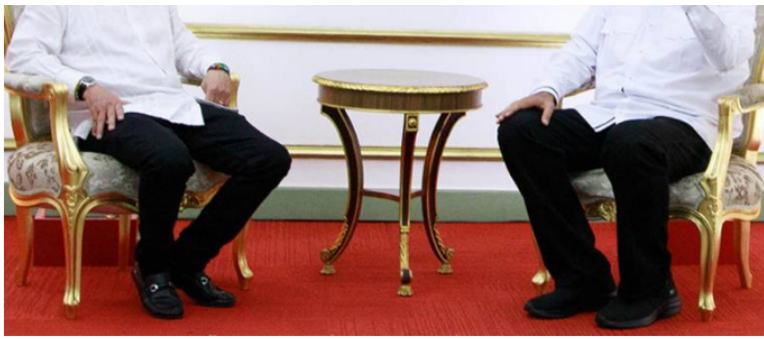
Gustavo Petro y Nicolás Maduro en la reunión realizada en Caracas.

“Es muy probable que Ecopetrol se vuelva socio de Pdvsa en la explotación de campos de gas y petróleo en Venezuela”, afirmó el jefe de estado, tras la reunión de este fin de semana.