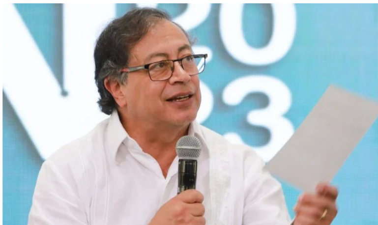
Gustavo, presidente de Colombia, en un evento público.

Síguenos en nuestro canal de noticias de WhatsApp