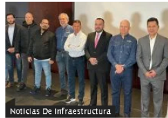
Noticias De Infraestructura

Hoy reunión de alto nivel entre Petro y empresarios de Colombia: ¿quiénes asistirán?