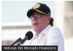
Noticias Del Mercado Financiero

A pesar de caída general en el sector, Arquitectura y Concreto aumentó venta de viviendas