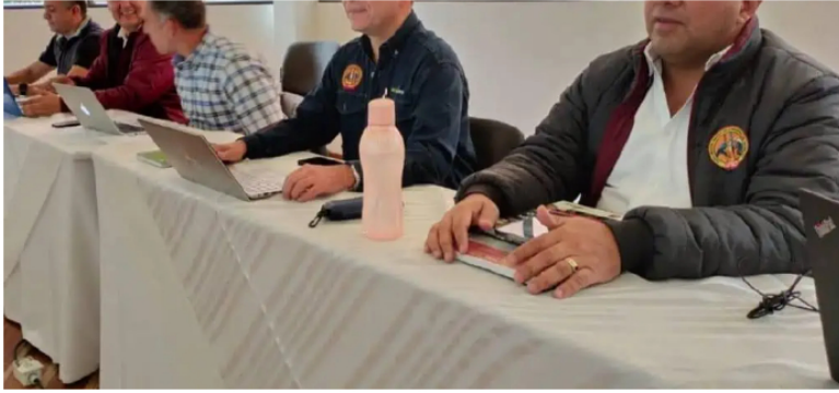
Sindicato USO de Ecopetrol .

la estatal petrolera de Ecuador (PetroEcuador) tiene cerca de la frontera con Colombia.