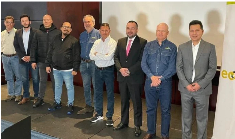
Peticiones de la USO a Ecopetrol .