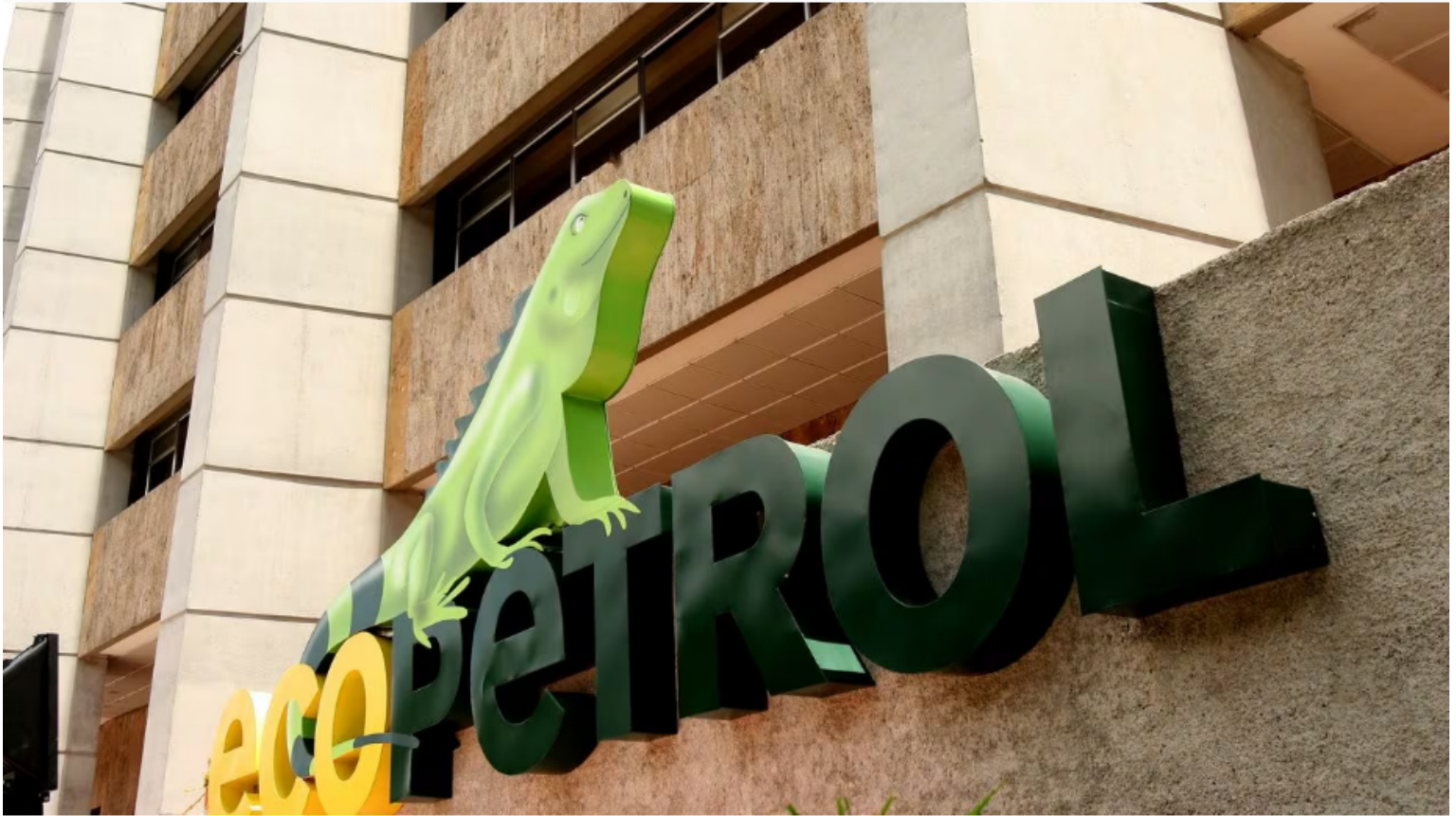
La acción de Ecopetrol repunta este martes en la BVC.