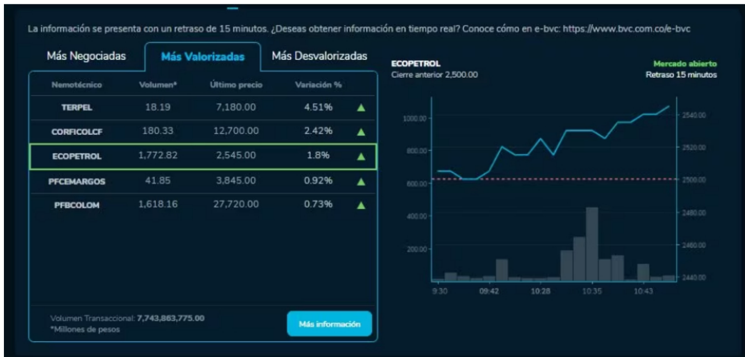
Así amanecieron las acciones de las empresas en la BVC durante este 21 de Noviembre.

Durante la jornada bursátil de este 21 de noviembre, la acción de Ecopetrol repuntó un 1,2 %, quedando en un precio de $2.530,00 por acción. El volumen de negociación de la petrolera es de unos 3.681,44 millones de pesos hasta el momento.