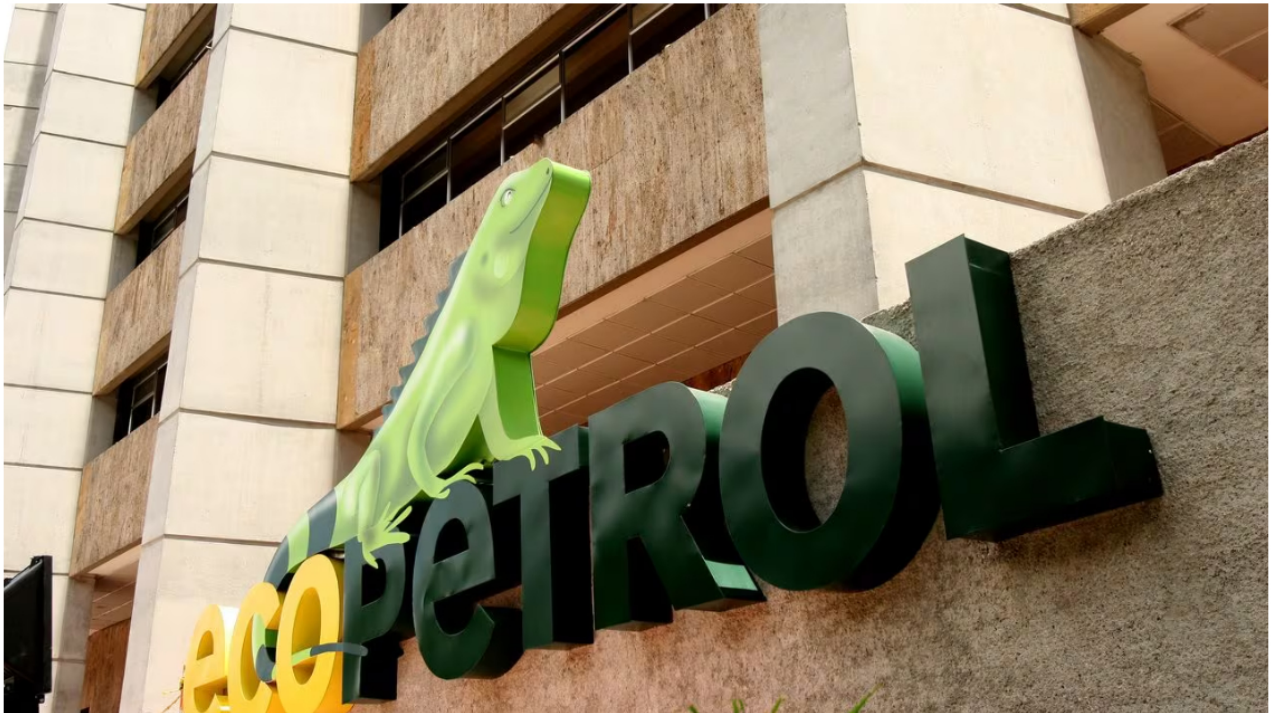
La junta de la petrolera, de mayoría estatal, explicó que la empresa ya tenía un "contrato suscrito con PDVSA desde el año 2007, con vigencia a 31 de diciembre de 2027".

Recientemente se desató una polémica en el país por cuenta de la propuesta del presidente de la República, Gustavo Petro, en su reciente visita a Venezuela, donde sostuvo una reunión con su homólogo Nicolás Maduro respecto a la posibilidad de asociar a Ecopetrol con la petrolera venezolana PDVSA.