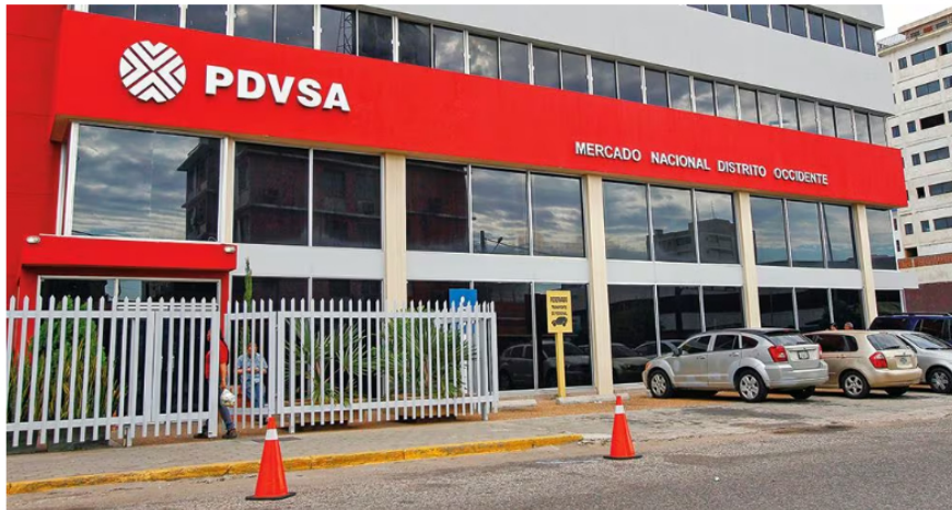
"Esto con la idea de asegurar en ambas vías, energía eléctrica hacia Venezuela, materias primas fósiles hacia Colombia, quizá, pasando por Cali hacia el Asia, asegurando la seguridad energética de estos dos países", reiteró Petro.

"Esto con la idea de asegurar en ambas vías, energía eléctrica hacia Venezuela, materias primas fósiles hacia Colombia, quizá, pasando por Cali hacia el Asia, asegurando la seguridad energética de estos dos países", reiteró Petro.