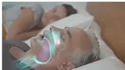
Dispositivo que reduce los síntomas del