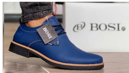
Zapato de cuero genuino, una rareza en