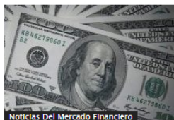
Noticias Del Mercado Financiero

Aeropuerto de Tolú: la megaobra de $123.000 millones que