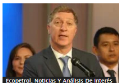
Ecopetrol, Noticias Y Análisis De Interés

En octubre cayó inversión extranjera en Colombia; hubo