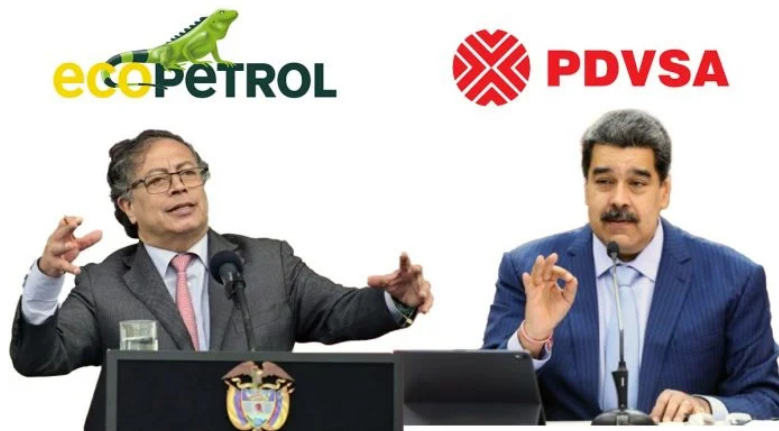
Propuesta de importar gas a Colombia desde Venezuela.