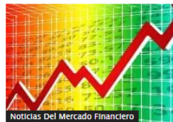
Noticias Del Mercado Financiero

Vuelve a bajar el dólar en Colombia: pierde $55 en la jornada de este 20 de noviembre