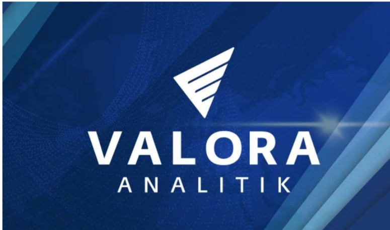
Las cinco noticias económicas más importantes del día en Valora Analitik