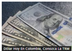
Dólar Hoy En Colombia, Conozca La TRM

En octubre cayó inversión extranjera en Colombia; hubo salida de inversión de portafolio