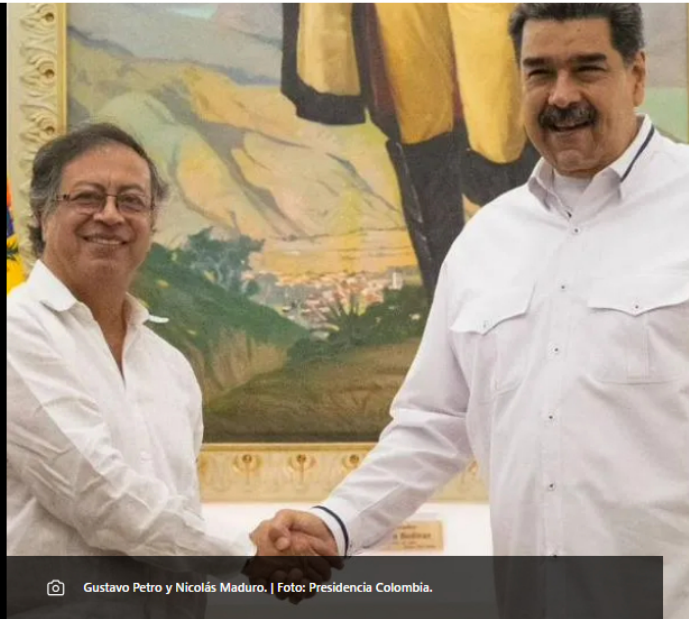
Gustavo Petro y Nicolás Maduro.