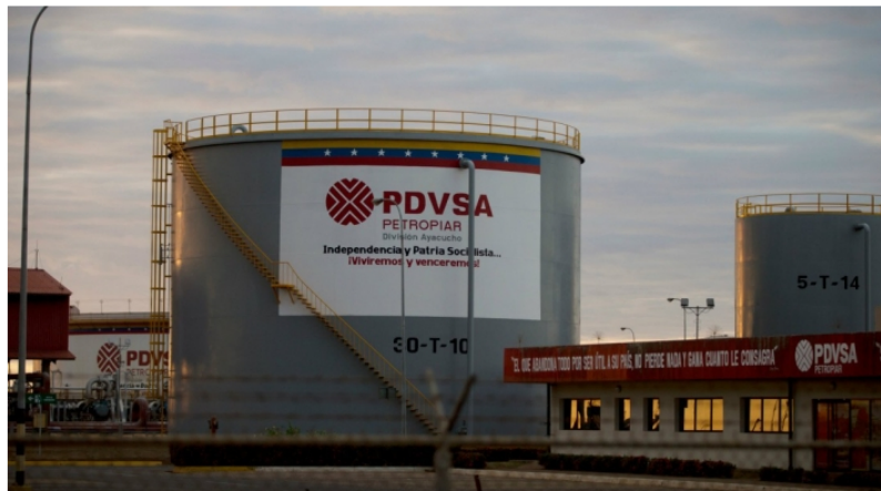
Petrolera estatal venezolana PDVSA.

Por: Aldair José Rodríguez Suárez Lunes, Noviembre 20, 2023 - 10:55