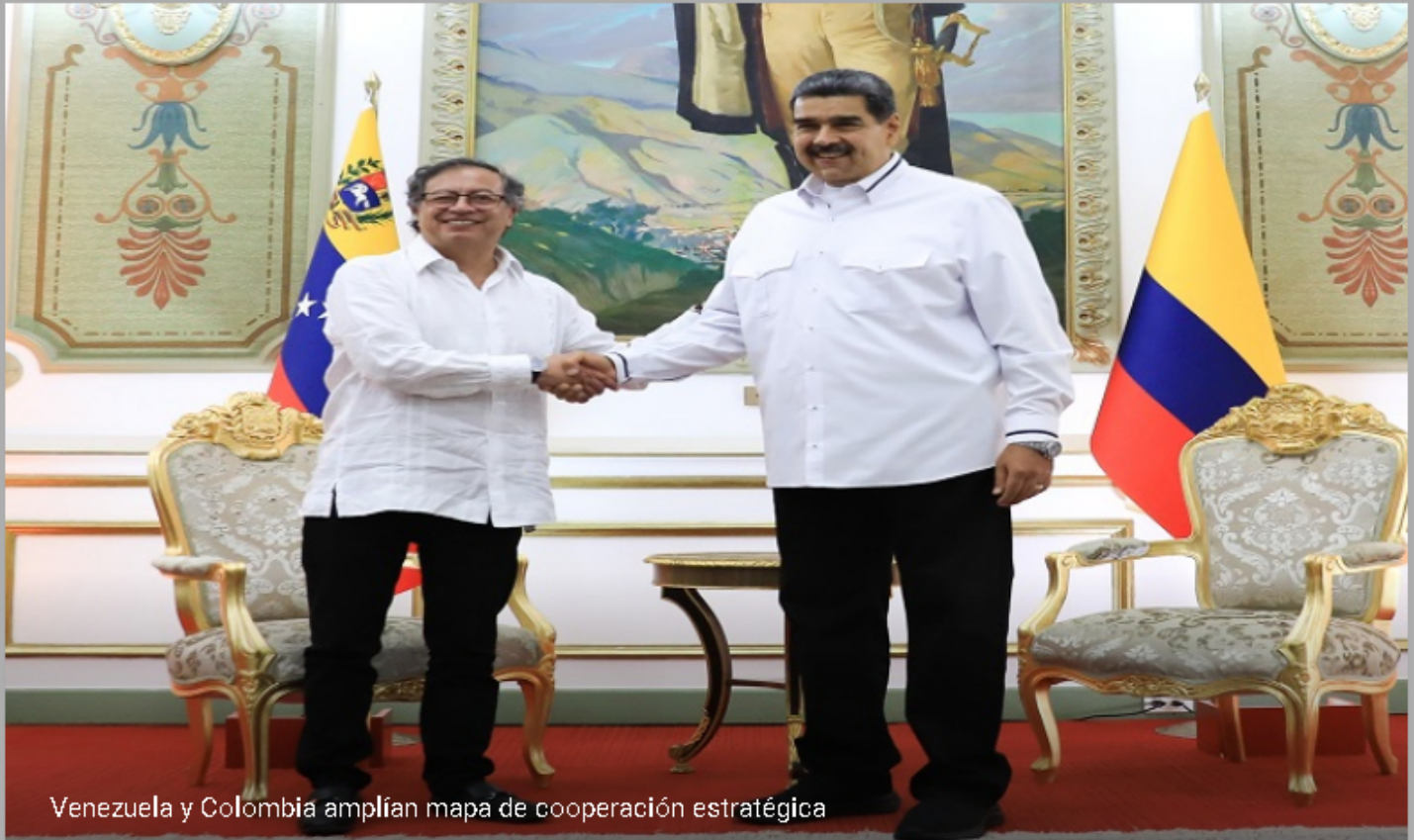
Venezuela y Colombia amplían mapa de cooperación estratégica