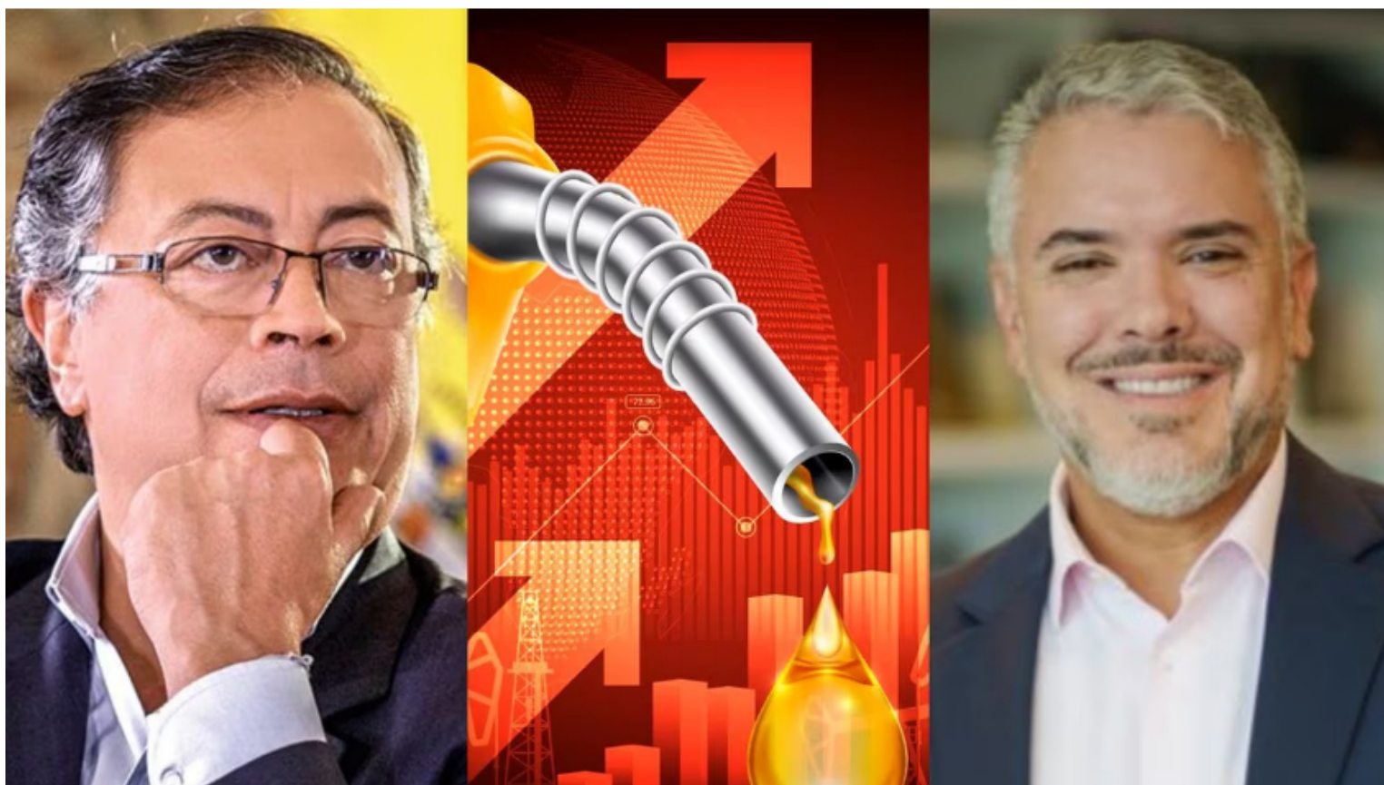
El expresidente Iván Duque lanza fuertes críticas a Gustavo Petro por propuesta de hacer alianza en el tema de hidrocarburos con Venezuela