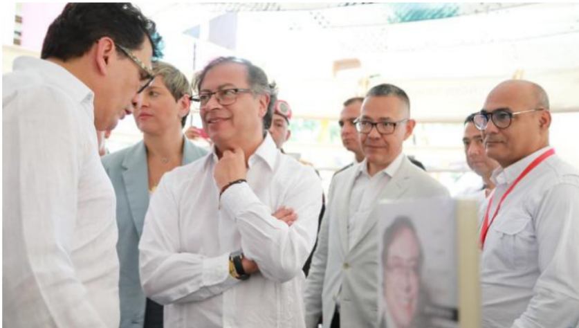
El presidente Petro visitó la Feria del Libro de Venezuela.

Finalmente, señaló que trabajarán en la creación de distritos turísticos para combatir la explotación de economías ilícitas. “Sustituir esas economías es el nuevo nombre de la paz, yo lo he llamado sustitución de economías, dado que la violencia de hoy ya no se basa en la ideología, sino en el simple trasegar de las economías ilícitas”, agregó.