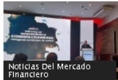
Noticias Del Mercado Financiero

Drummond tendrá que hacer consulta previa con comunidad Yukpa por minas de carbón