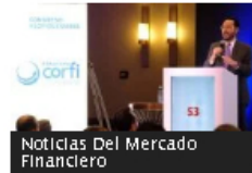
Noticias Del Mercado Financiero

Gerente del BanRep: probablemente PIB de Colombia a cierre de 2023 no alcanzará 1,2 %