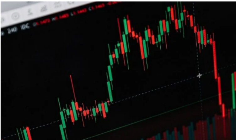
Índices bursátiles en bolsas