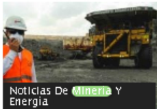
Noticias De Minería Y Energía

Drummond tendrá que hacer consulta previa con comunidad Yukpa por minas de carbón