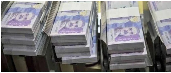
Pesos Colombianos.

A su vez, el exministro de Hacienda, Juan Carlos Echeverry, puso sobre la mesa una discusión que tiene que ver con las decisiones que se tomen en la próxima asamblea de Ecopetrol .