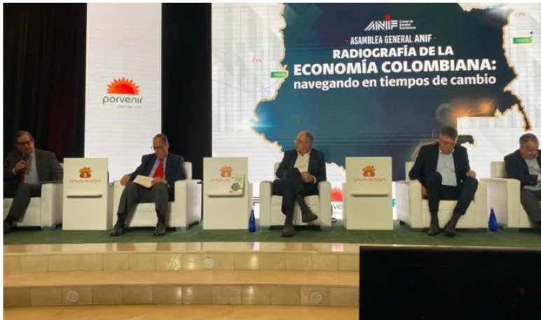
Exministros de Hacienda sobre panorama fiscal de Colombia.

Síguenos en nuestro canal de noticias de WhatsApp