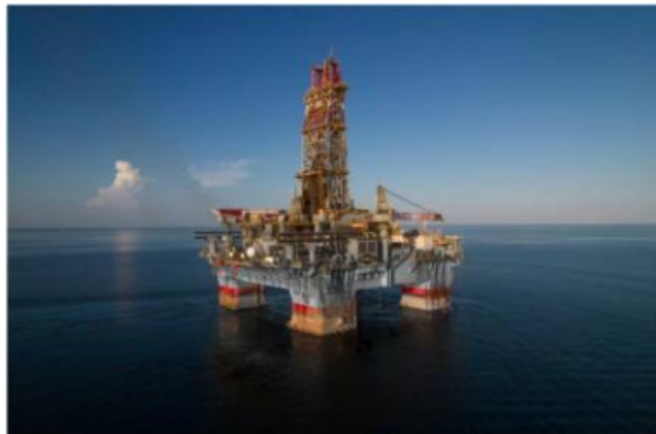
Ecopetrol tiene el apoyo de la compañía Noble Corporation para la operación de la plataforma

La empresa Ecopetrol informó que inició operaciones para la perforación del pozo delimitador Orca Norte 1, como parte de la estrategia de priorizar los proyectos de gas natural que hacen parte del portafolio de la compañía y contribuirán a apalancar el programa de transición energética sobre el cual avanza el gobierno del presidente Gustavo Petro en Colombia.