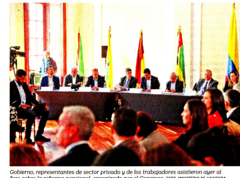
Gobierno, representantes de sector privado y de los trabajadores asistieron ayer al foro sobre la reforma pensional, organizado por el Congreso.

Al referirse al punto de los aportes, uno de los puntos que más criticó el ministro Bonilla, el vocero gremial explicó que las cotizaciones quedan como están, pero lo que les inquieta es que, con