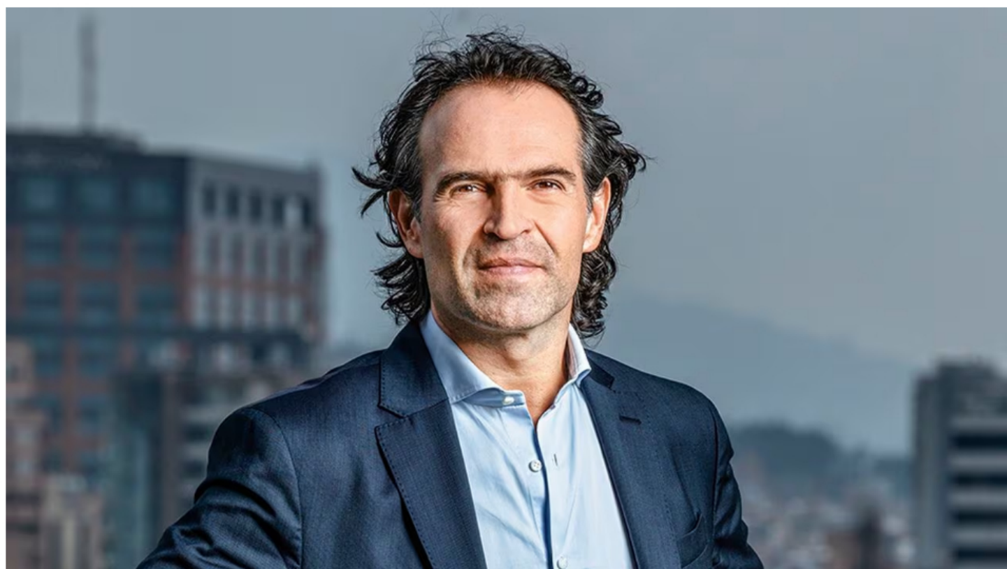
Federico Gutiérrez, alcalde electo de Medellín.

Una amplia expectativa ha generado el anuncio del alcalde electo en Medellín, Federico Gutiérrez, que adelantó a través de sus redes sociales que este mismo miércoles en la mañana dará a conocer el nombre de quien será el gerente de EPM durante su administración.